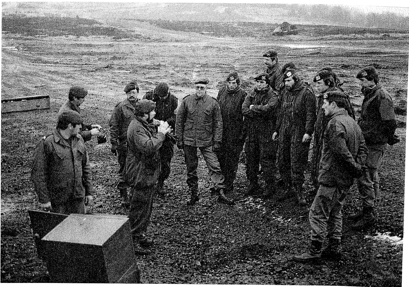
'TOW-instructie' te velde met behulp van een videoband.

pensysteem afgevuurd. De volgende club staat al te trappelen van ongeduld om te gaan schieten, maar eerst wordt nog even naar het 'kastje' gekeken. De instructeurs van het OCI leggen per schot uit wat goed en wat eventueel fout is gegaan. 'Kijk, dat is typisch een voorbeeld van een schrikreactie, maar toch goed opgevangen. Dié schutter was duidelijk de kluts kwijt! Zien jullie het nu?' etc. etc. We hopen nu maar dat iedereen het nu weet. En in de maand mei (of juni?) mogen ze weer een keer met scherp schieten.